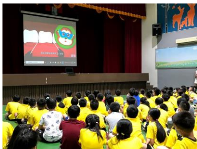
推動午餐潔牙活動