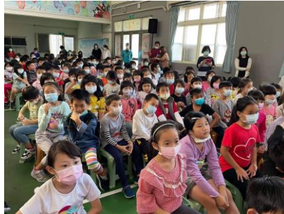
兩餐間不喝含糖飲料調查