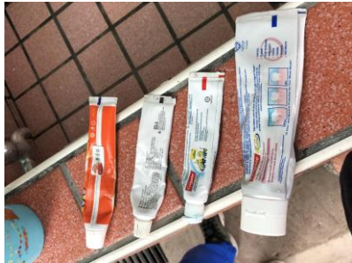
午餐後搭配含氟牙膏