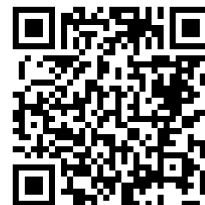
桃園市公立及非營利幼兒園 招生網