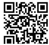
桃園市國民小學藝術才能國樂班 鑑定線上報名系統