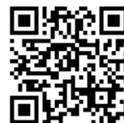
桃園市國民小學藝術才能國樂班 鑑定線上報名系統