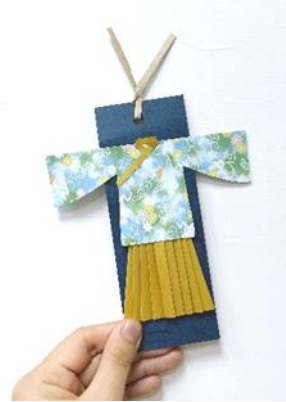
雅樂舞動佻起來-平安服手作書籤