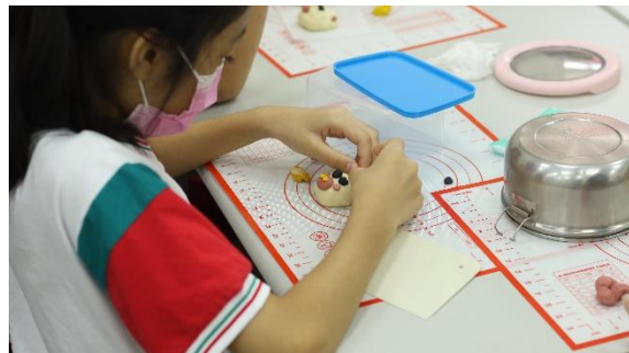
不時不食-太牢製作