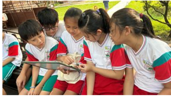
神社小學堂-神社與環境的關係