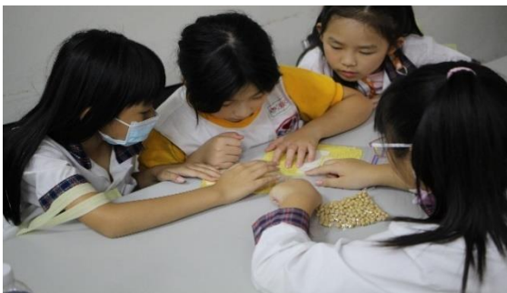
不時不食-認識五穀