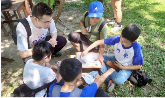
神社小學堂-神社保存價值討論