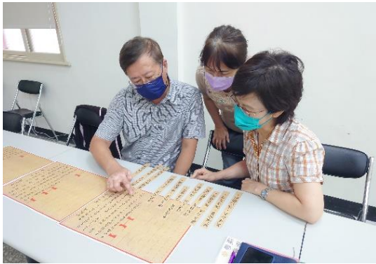
雅樂舞動佻起來-佻舞歌詞拼拼樂